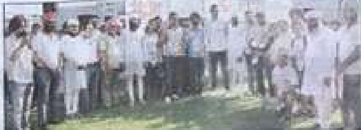
सोमवार को सभी खिलाड़ियों को प्रशस्ति पत्रों के साथ सम्मानित किया गया। (बाएं) लुधियाना में आयोजित 'दिल की दौड़' कार्यक्रम में भाग लेने वाले एक खिलाड़ी। (दाएं) लुधियाना में आयोजित 'दिल की दौड़' कार्यक्रम में भाग लेने वाले एक खिलाड़ी।